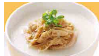
223 牛モツ粥 (Sサイズ)¥560 ¥800