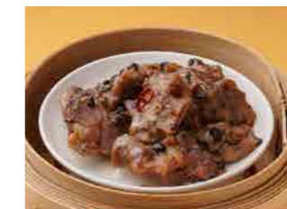
299 豚スペアリブの黒豆ソース蒸し ¥980