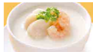
228 海鮮粥 (Sサイズ)¥1,120 ¥1,600