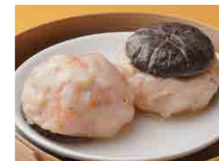
290 海老すり身椎茸重ね蒸し ¥700