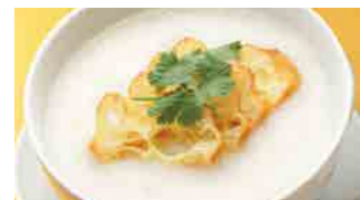
221 白粥 (Sサイズ)¥420 ¥600