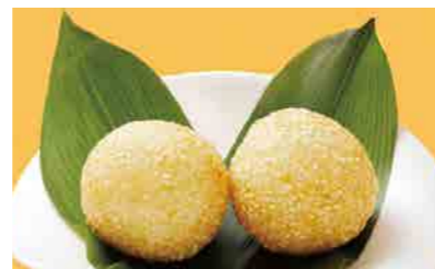
373 ゴマ団子 ¥660