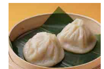
288 小籠包 ¥520