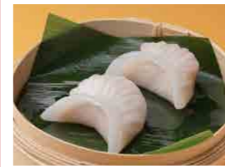
281 海老蒸し餃子 ¥480