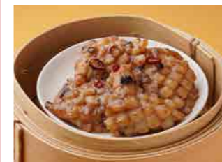
297 イカの黒豆ソース蒸し ¥1,300