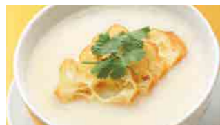
222 豆乳粥 (Sサイズ)¥420 ¥600