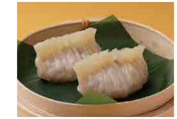
284 ふかひれ蒸し餃子 ¥1,100