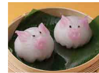
283 こぶた餃子 ¥800