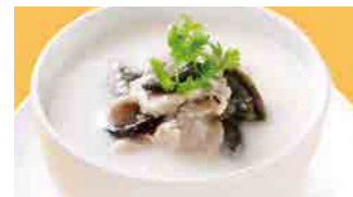
225 豚肉とピータン粥 (Sサイズ)¥770 ¥1,100