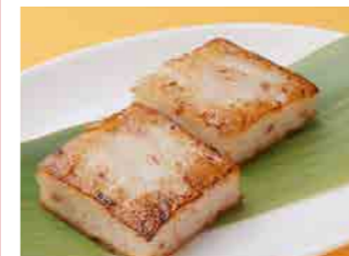
289 大根餅 ¥580