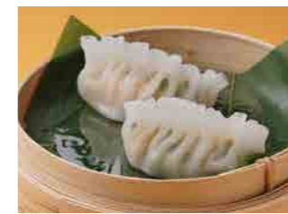
282 海老入りニラ餃子 ¥500