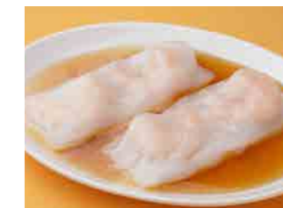
291 海老キシメン包み ¥800