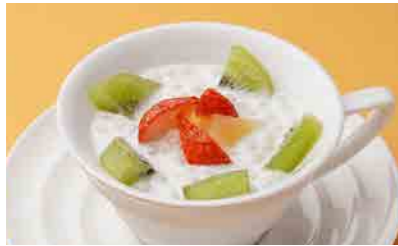
371 タピオカ入りココナッツミルク ¥580