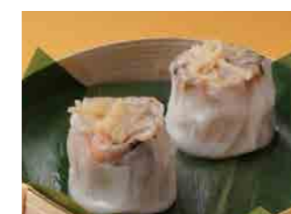
287 干し貝柱肉焼売 ¥860