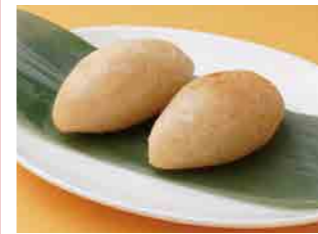
293 五目餅揚げ ¥600