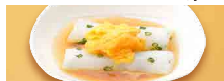
263 キシメン卵 ¥350