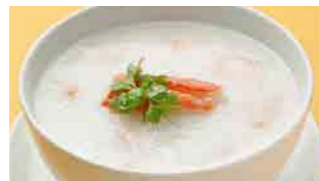
227 蟹肉粥 (Sサイズ)¥1,120 ¥1,600