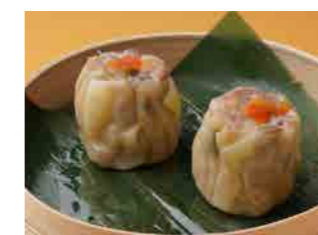
286 香港式海老焼売 ¥500