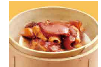
300 豚足蒸し ¥820