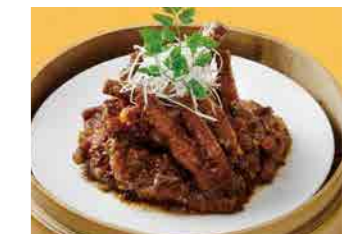
296 鶏足の黒豆ソース蒸し ¥920