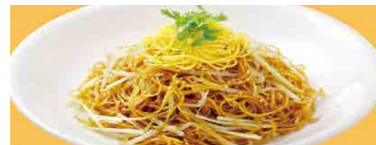
262 黄ニラ焼きそば ¥1,200