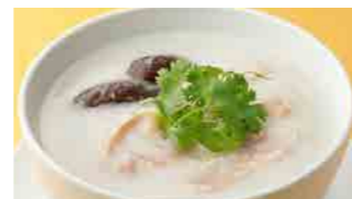
224 鶏粥 (Sサイズ)¥630 ¥900