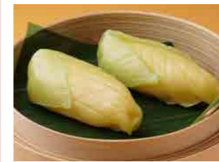
285 とうもろこし餃子 ¥600