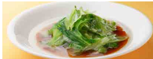
261 レタスの湯がき ¥400