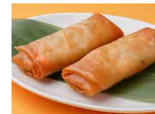
294 春巻 ¥700