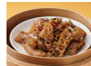
298 牛モツの黒豆ソース蒸し ¥900