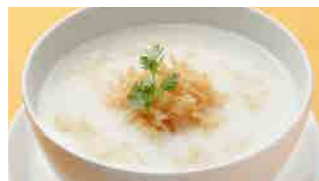
226 干し貝柱粥 (Sサイズ)¥770 ¥1,100