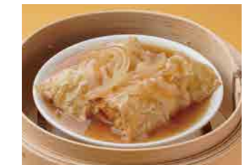
292 筍の湯葉巻き ¥900