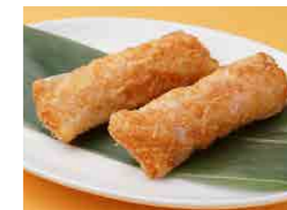
295 海老の紙包み揚げ ¥940