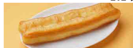
264 揚げパン(ユーツィアオ) ¥280