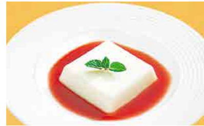
372 杏仁豆腐 山桃ソース ¥700